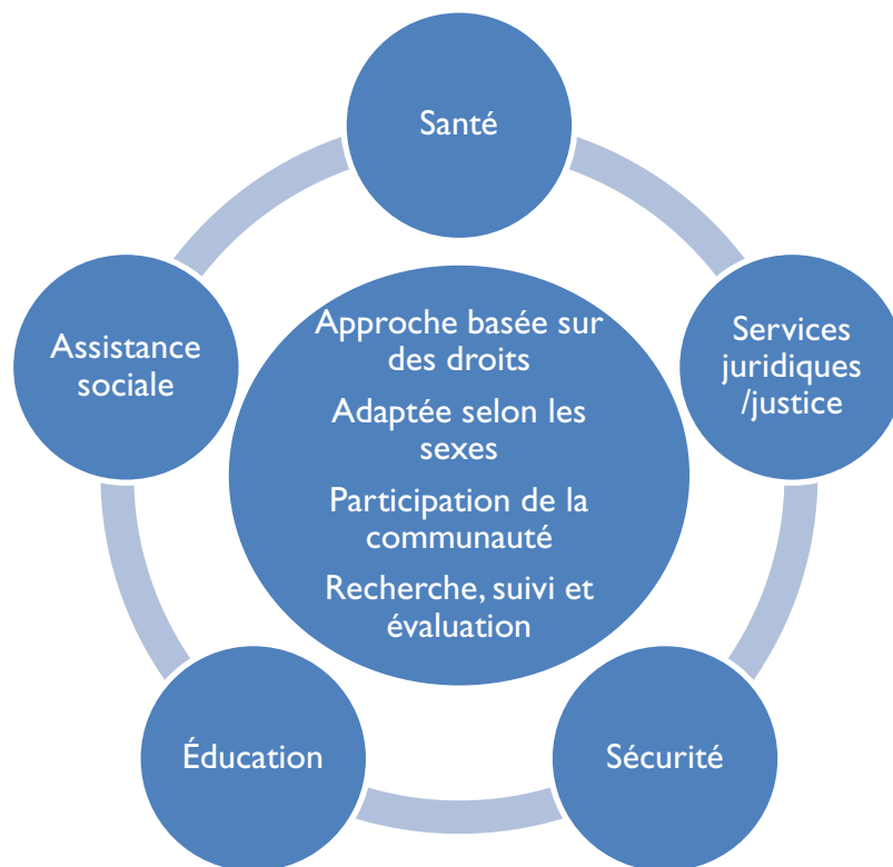
Figure 1. Action globale et multisectorielle contre les violences basées sur le genre

Bien qu'il existe une dynamique politique croissante pour l'éradication des violences basées sur le genre, notamment par le renforcement des liens avec les programmes de lutte contre le VIH, ce guide a été rédigé avec l'hypothèse que les programmes de lutte contre le VIH doivent déjà fonctionner avec de fortes contraintes budgétaires et de ressources. Cette constatation ne vise pas à décourager ou à réduire la volonté d'agir contre les violences basées sur le genre. Elle vise plutôt à reconnaître le fait que les planificateurs et les gestionnaires de programmes doivent continuer à faire plus avec les budgets existants et qu'ils devront miser sur un effort accru d'intégration, de coordination et d'accroissement de l'efficacité dans leurs activités de développement. Par conséquent, ce guide ne vise pas à tracer une voie obligatoire et ne suppose aucunement que tous les programmes pourront adopter l'ensemble des stratégies et des programmes présentés ici.